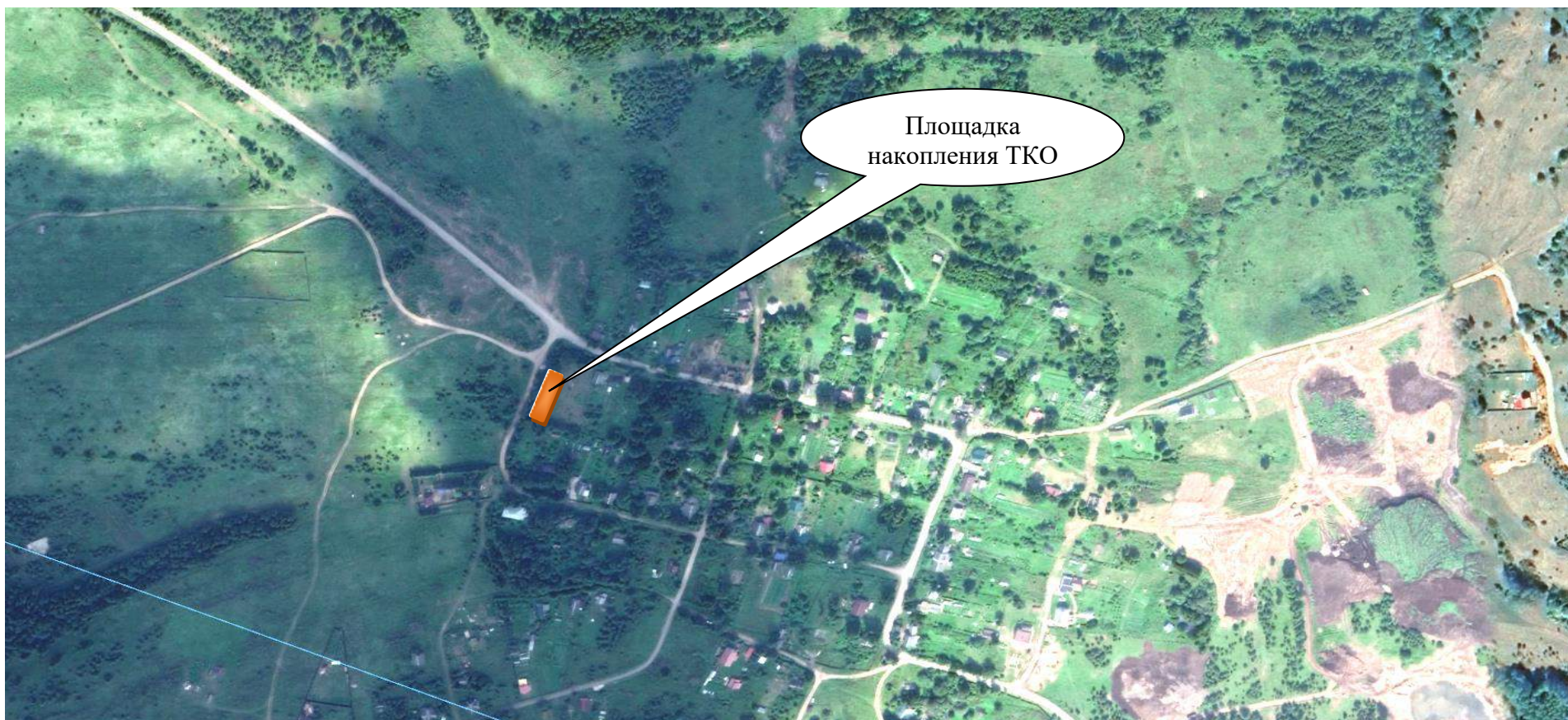
Схема размещения площадки накопления ТКО в деревне Ящерово