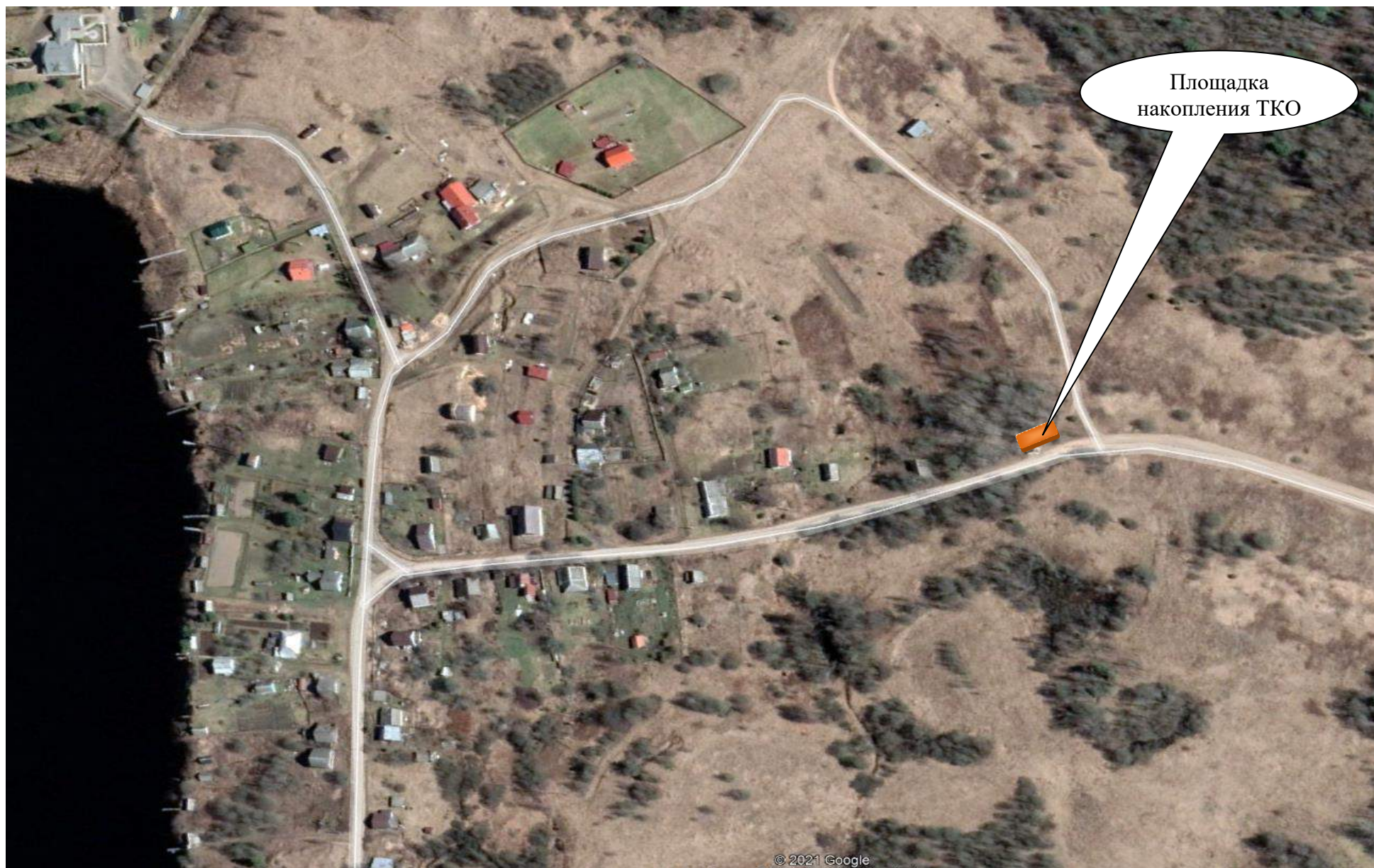
Схема размещения площадки накопления ТКО в деревне Нелюшка